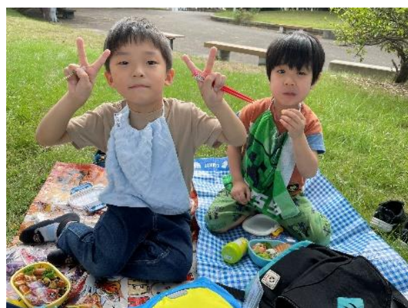
竹・菊組さんはみなと公園で♪「大好きなおかずが入ってる〜♡」