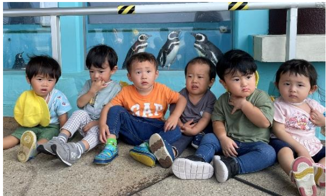
ペンギンの前でパシャッ!!