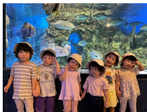
魚の泳ぐ水槽の前でポーズ☆