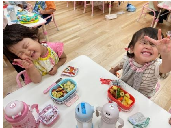
桃・りす・ひよこ組さんはこども園で♪「美味しそうでしょ〜♡」