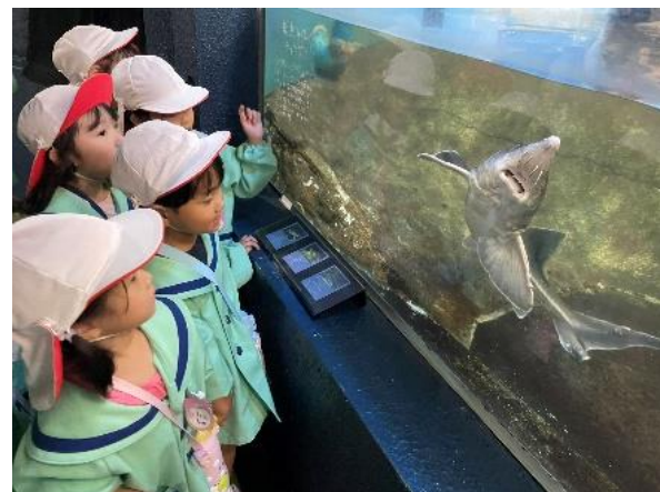
ウミガメのお出迎え★