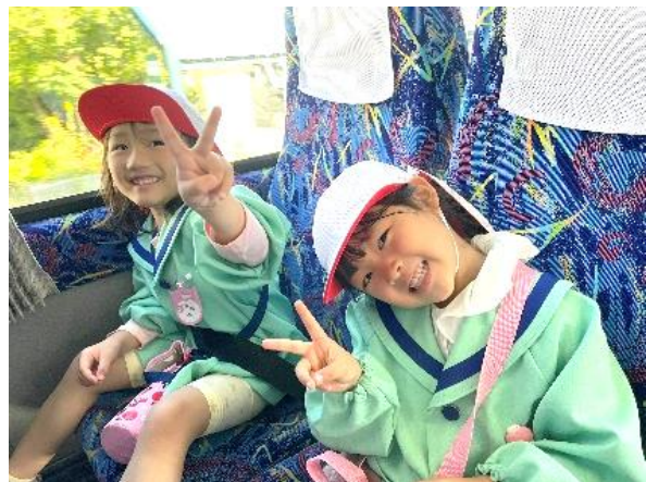
大きなバスに乗って、いざ水族館へ!